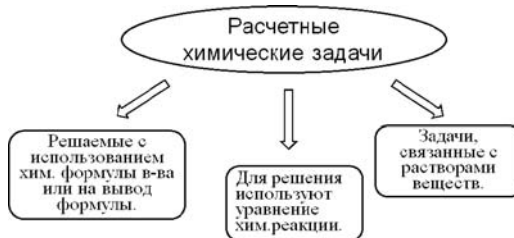
Рис. 2. Классификация расчётных задач по способу решения

При знакомстве со структурой решения расчётных химических задач мы обсуждаем со студентами, что в ней выделяют две части: химическую и математическую .