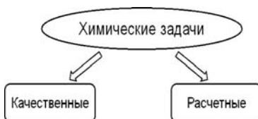
Рис.1. Классификация задач по содержанию данных

Проведение курса «Решение химических задач» позволяет познакомить студентов первого курса с общепринятыми методическими подходами [13, 20, 23, 27] к классификации школьных задач по различным признакам, со структурой решения школьной химической задачи (рис. 1–3). Помимо решения задач студенты знакомятся с отдельными приёмами составления разных видов качественных и несложных расчётных химических задач на материале общей и неорганической химии школьного курса.