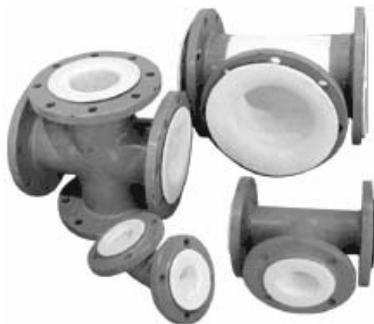
Рис. 1. Детали трубопроводов, футерованных фторопластом

Заводы продолжают осваивать новые виды продукции. В настоящее время они предлагают широкий набор таких инженеринговых услуг, как проектирование и изготовление химически стойких технологических линий, а также отдельных аппаратов, футерованных фторопластами в соответствии с требованиями заказчика: стальных скрубберов, реакторов, колонных аппаратов (ректификационных и других колонн), теплообменников; компоновка крупногабаритного емкостного оборудования из отдельных футе-