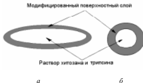
Рис. 2. Схематическое изображение ферментсодержащих набухшей пленки (а) и капсулы (б), поверхностно модифицированных ДСН

ую и ранозаживляющую активность, при этом последняя может быть усилена присутствием протеолитического фермента. В качестве реагента для модифицирования поверхности хитозановой пленки нами был выбран ДСН, мицеллообразующее анионообменное ПАВ, способное к образованию ионных связей с протонированными аминогруппами. В результате модификации обработкой раствором ДСН на поверхности трипсинсодержащей хитозановой пленки формируется нерастворимый в воде слой ПАВ-полиэлектролитного комплекса. Таким образом, модифицированная пленка состоит из нерастворимых в воде поверхностных слоев и внутреннего слоя, в состав которого входят водорастворимые немодифицированные полимеры – хитозан и трипсин. Исследование смеси растворов трипсина и хитозана методом гель-хроматографии на колонке, предварительно откалиброванной по нативному трипсину и хитозану, показало, что значительная часть фермента входит в состав полиэлектролитного комплекса с хитозаном, о чем свидетельствует появление соответствующего пика на хроматограмме (рис. 1).