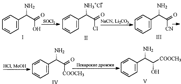
С х е м а 1

В литературе описано несколько методов синтеза N-бензоилфенилизосерина, позволяющих получить микроколичества этого соединения [3–5]. Изначально мы предприняли попытку разработать препаративный синтез N-замещенных производных фенилизосерина на основе метода, описанного в работе [3] и протекающего по схеме 1. Исходным соединением в этом случае является фенилглицин (I), который в четыре стадии превращается в метиловый эфир фенилизосерина (V). На заключительной стадии для восстановления карбонильной