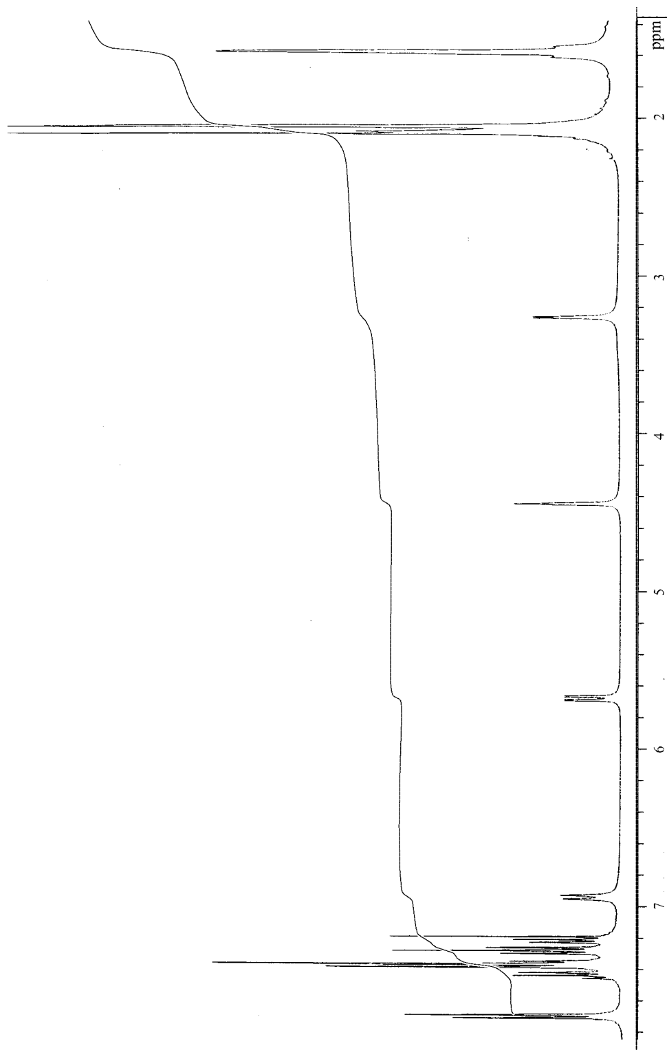
Спектр ЯМР ^1\text{H} ( \delta , м.д., \text{CDCl}_3/\text{ТМДС} ) (N-бензоил- \beta -фенилизосеринил)-адамантана (XVIII)